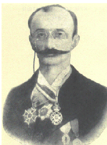
Ο Μανουήλ Ι. Γεδεών σε ηλικία περίπου 50 ετών

Όλα αυτά στηριγμένα σε πρωθιγμένες και λεπτομερειακές έρευνες των χειρόγραφων και των έντυπων πηγών, τις οποίες ο Γεδεών ήξερε να πλουτίζει με στοιχεία αντλημένα από μια μακρά προφορική παράδοση· της τελευταίας αυτής συνέλαβε, πολύ νωρίς, τη σημασία και φρόντισε, όσο μπορούσε, να την απομνημονεύσει: σ' αυτή την πλευρά του έργου του αναφέρονταν ο Κ. Θ. Δημαράς όταν αποκάλεσε παλιότερα τον Μανουήλ Γεδεών πηγή της νεώτερής μας ιστορίας.