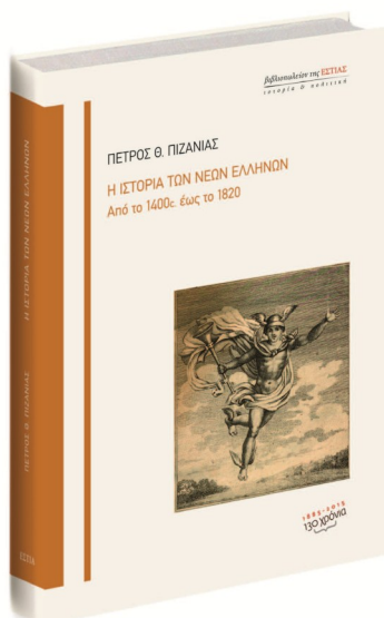
Σχήμα 17 x 24, 556 σελίδες Χαρτόδετο ISBN 978-960-05-1622-7

βιβλιοπωλείον της ΕΣΤΙΑΣ ιστορία & πολιτική